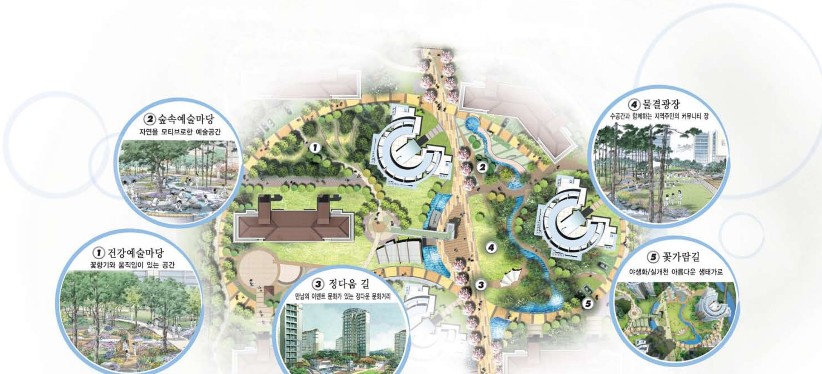
② 숲속예술마당 자연을 모티브로한 예술공간