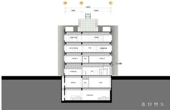
중 단 면 도