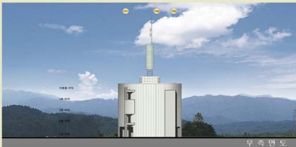
우 측 면 도