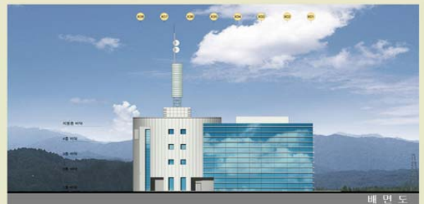
배 면 도