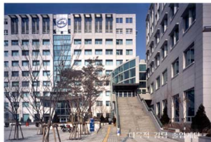
다목적 강당 중입면도